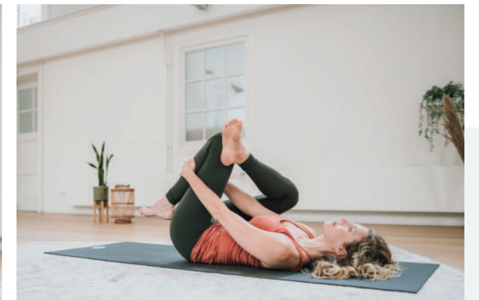
De Eye of the Needle